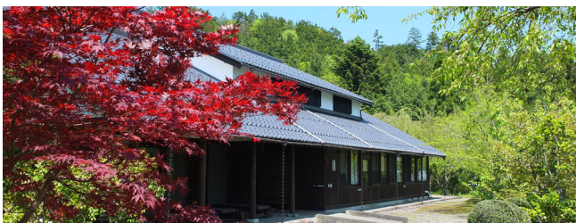
若州一滴文庫 (福井県大飯郡おおい町岡田)